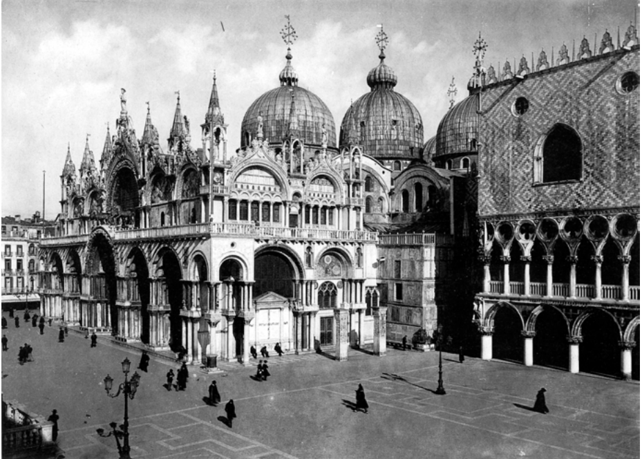
Abb. 10: Ansicht der Südfassade von San Marco, Venedig, Aufnahme des späten 19. Jh.s (Photo: PATRICIA FORTINI BROWN: Venice & Antiquity. The Venetian Sense of the Past. New Haven/London 1996, S. 20, Abb. 20)

spektakulär noch für die Gegenwart fruchtbar zu machen und geriet wohl nicht zuletzt deshalb in Vergessenheit. 75 Augenscheinlich ‚alt‘, semantisch ‚neutral‘, das heißt nicht eindeutig auf bestimmte Kontexte oder Deutungen festgelegt, und im