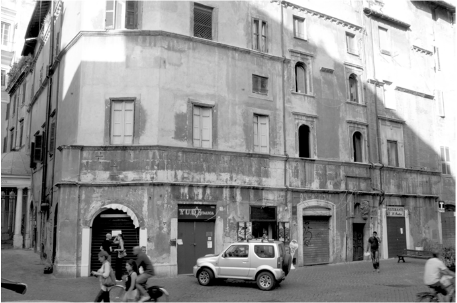
Abb. 1: «Casa Manlio», Wohn- und Ladenhaus des Lorenzo Manlio in der jetzigen Via del Portico di Ottavia, begonnen 1476, Rom