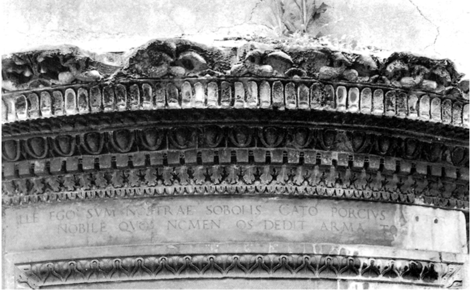
Abb. 7: Fragment eines antiken Gesimses als Türsturz im Innenhof, Rom, «Casa Porcari» (Photo: SILVIA DANESI SQUARZINA: Francesco Colonna, principe letterato e la sua cerchia. Storia dell'arte 1987, S. 137–154, Abb. 4)

Johann Faber erregte und schließlich auf das Kapitol gelangte. 15 Auch für andere Familienmitglieder ist überliefert, daß sich Skulpturen von Schweinen in ihrer Sammlung befanden. 16