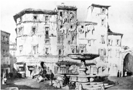
Abb. 2: «Casa Manlio» in einer Ansicht des 19. Jahrhunderts