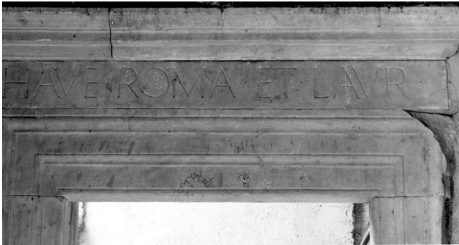
Abb. 4: Inschrift auf einem Türsturz im ersten Obergeschoß, Rom, «Casa Manlio»