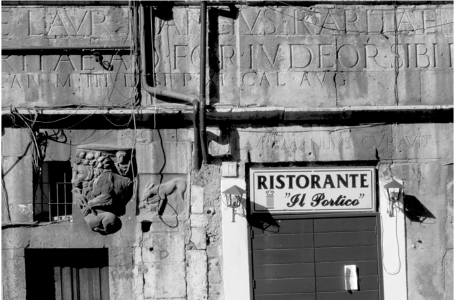
Abb. 5: Detail der Fassade mit Bauinschrift, Fragment eines römischen Sarkophags und griechischer Grabstele, Rom, «Casa Manlio»