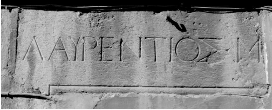
Abb. 3: Inschrift im Erdgeschoß, Rom, «Casa Manlio»