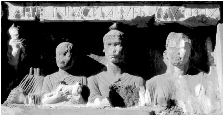
Abb. 6: Römisches Grabrelief mit Büsten einer Familie, Rom, «Casa Manlio»

Die Anbringung der antiken Reliefs erscheint nur auf den ersten Blick wahllos. Das eindrucksvolle Fragment eines Sarkophags, auf dem ein Löwe eine Antilope schlägt, und ein griechisches Grabrelief mit einem hasenwürgenden Hund (Abb. 5) befinden sich rechts der Türöffnung, die zwischen den Läden den einzigen Zugang zu den