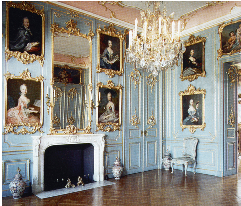
Abb. 14: Calden bei Kassel, Schloss Wilhelmsthal, Erstes Vorzimmer des hessischen Landgrafen mit ›Schönheitengalerie‹.