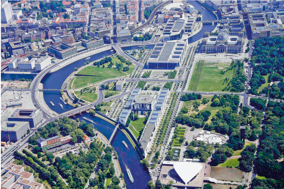
Abb. 5: Berlin, Luftaufnahme des Regierungsviertels mit Bundeskanzleramt, Paul-Löbe-Abgeordnetenhaus und Reichstag.