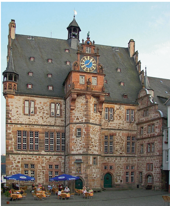
Abb. 6: Marburg an der Lahn, Rathaus und Marktplatz.