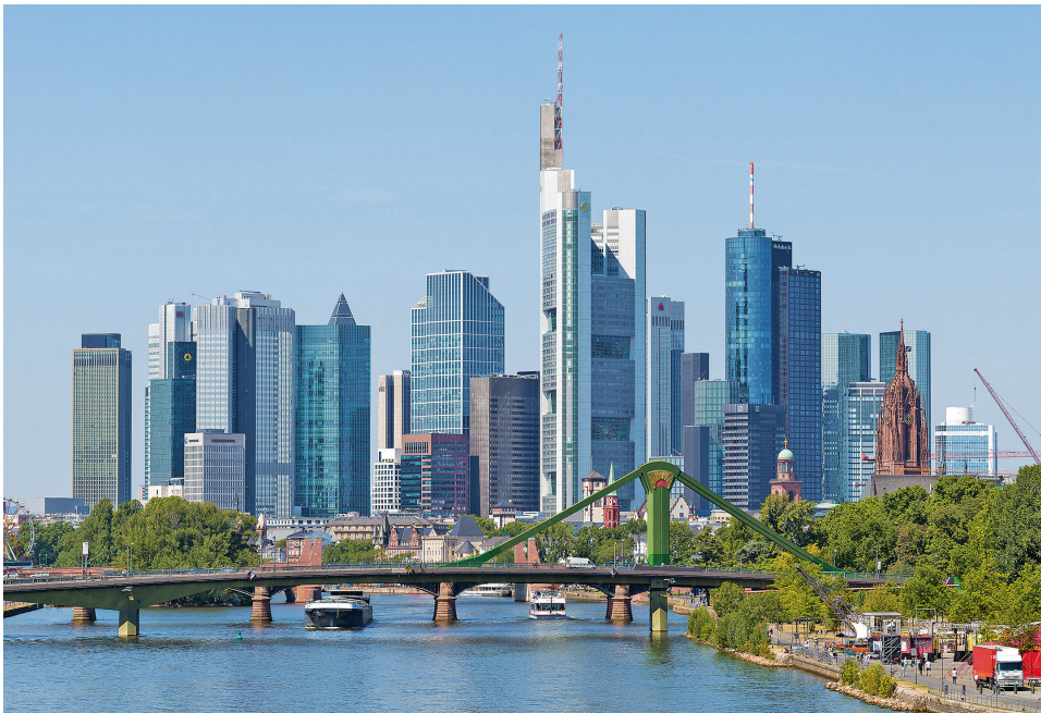
Abb. 2: Frankfurt am Main, Blick auf die Skyline mit den Bankenhochhäusern und dem Domturm (rechts).