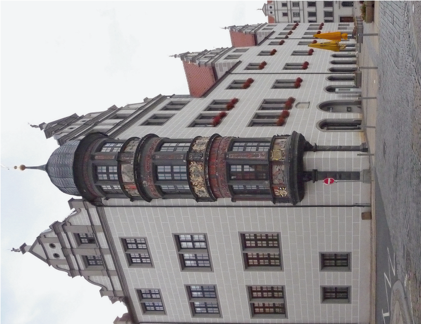
Abb. 7: Torgau, Rathaus mit Ratsker.