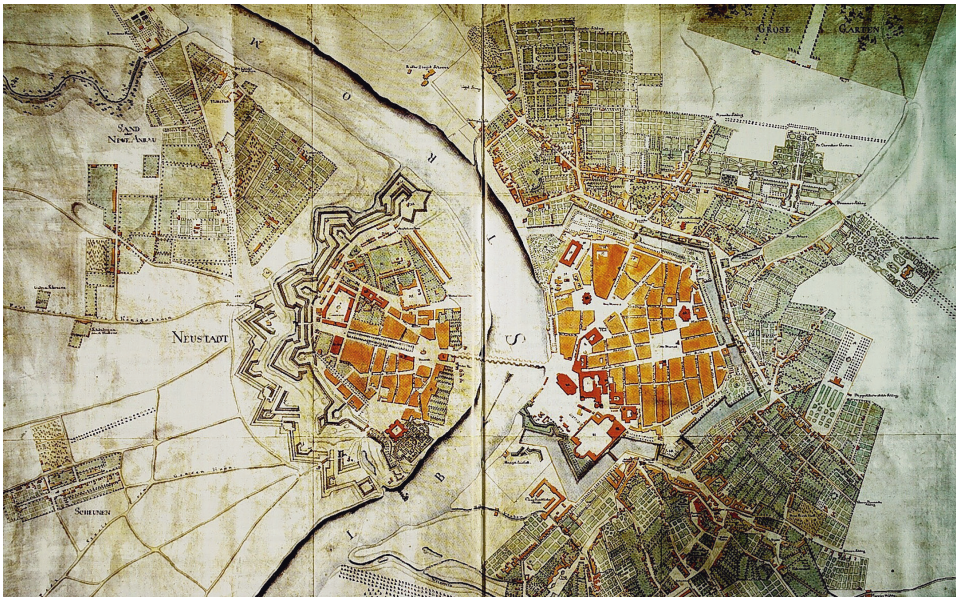
Abb. 10: Plan von der churfürstlich-sächsischen Residenzstadt Dresden, nebst Neustadt bei Dresden, um 1770 (aus: HERTZIG, Stefan: Das Dresdner Bürgerhaus des Spätbarock, Dresden 2007, S. 24f.).