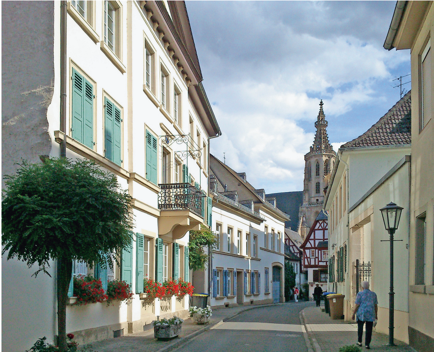
Abb. 3: Meisenheim am Glan, Obergasse mit Fürstenwärther Hof und Ritterherberge sowie Blick auf die Pfarr- und Schlosskirche.