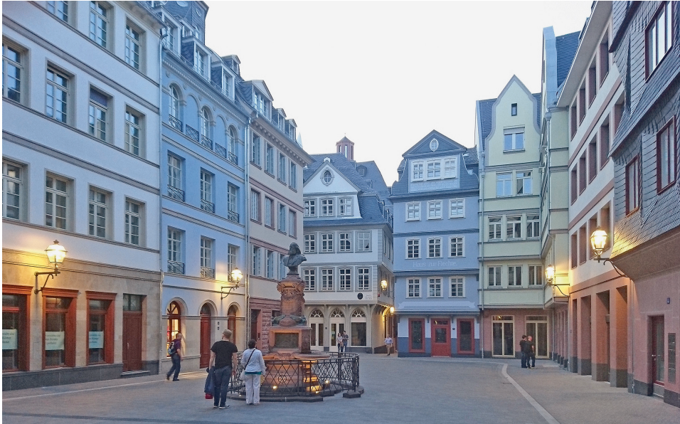
Abb. 1: Frankfurt am Main, Blick in die 2018 fertiggestellte »Neue Altstadt« (Foto: Matthias Müller).