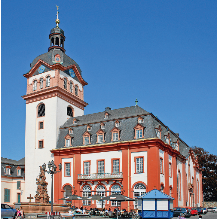
Abb. 11: Weilburg an der Lahn, Blick auf die Schloss- und Stadtkirche mitsamt dem davorgesetzten Rathaus (Foto: Matthias Müller).