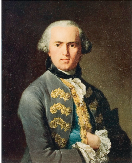
Abb. 13: Johann Heinrich Tischbein d.Ä., Selbstbildnis in mittleren Jahren, um 1760 (Öl auf Leinwand, 80,8 x 62,4 cm. Museumslandschaft Hessen-Kassel, Gemäldegalerie Alte Meister, Schloss Wilhelmshöhe, Inv.-Nr. GK 985a.