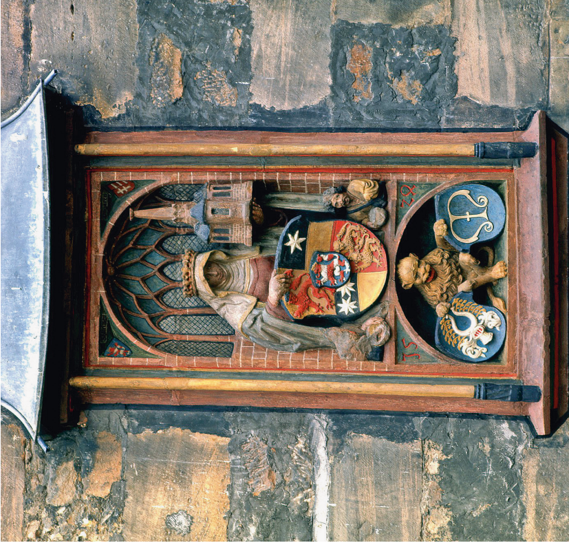
Abb. 8: Marburg an der Lahn, Rathaus, Wappenrelief am Treppenturm.