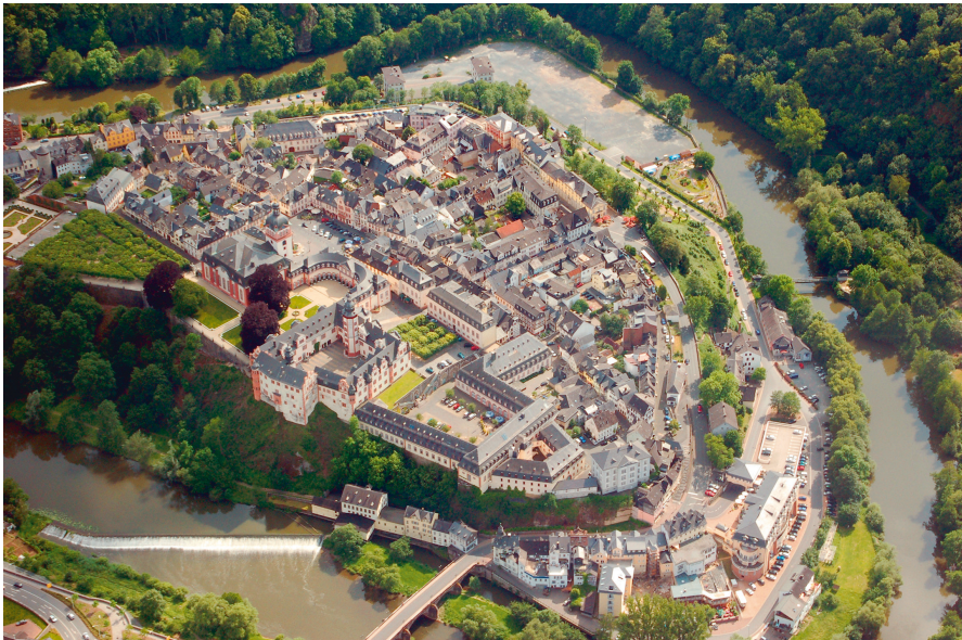
Abb. 4: Weilburg an der Lahn, Luftaufnahme.