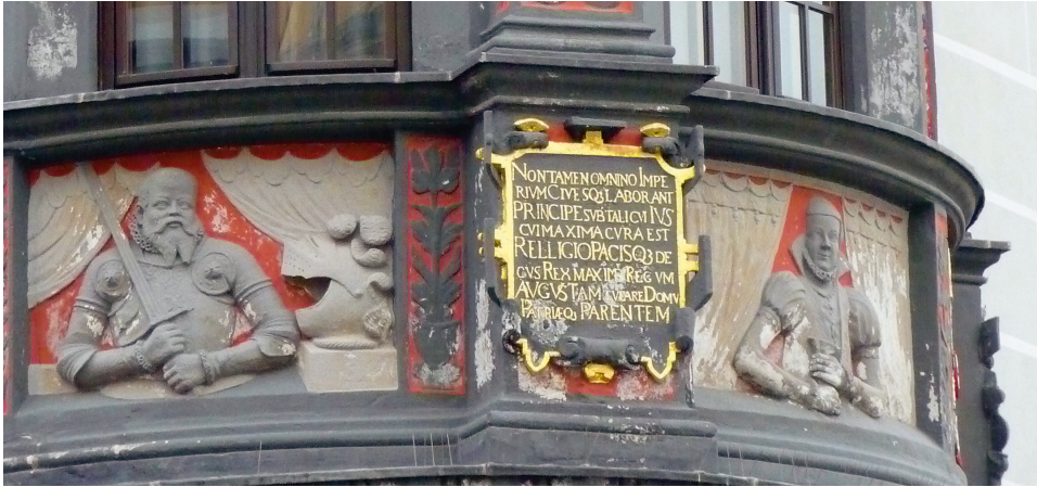
Abb. 9: Torgau, Rathaus, Ratskerker mit Bildnissen des sächsischen Kurfürsten August und seiner Ehefrau Anna sowie der Inschrift mit dem Fürstenlob als >Pater patriae<.