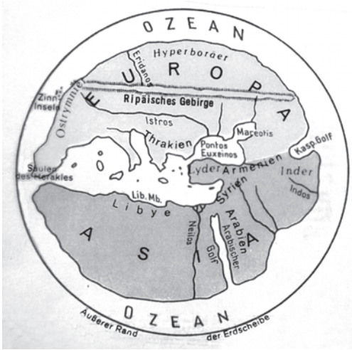
Abbildung 2: „Erdkarte“ des Hekataios 28 .

Die drei Fragen können behilflich sein, der Besonderheit der Theogonie auch im Hinblick auf nicht schon ‚erledigte‘ Problemstellungen (oder auch éternelles questions ) wie dem „Davor“ oder dem „Chaos“ näher zu kommen. Frage eins impliziert, wenn man weiterdenkt, die Frage nach dem jeweiligen „Ist“, nach der Vorstellung von dem, was jetzt ist, als das auch materielle Resultat jenes Prozesses, der mit dem Anfang begann. Es ist das Weltbild in einem sehr wörtlichen Sinn. Mit dem bei den Griechen ältesten rekonstruierbaren – natürlich umstrittenen – Zeugnis gelangt man, wiederum über dessen nachweisbare Vorlage, immerhin bis in die Anfänge des 6. Jahrhunderts vor Christus zurück und damit in die bereits weit fortgeschrittene Kolonisationsära. Es ist die sogenannte „Weltkarte“ oder genauer „Erdkarte“ des Hekataios aus Milet, dem an der südwestanatolischen Ägäisküste liegenden frühen Zentrum der – vor allem die Seewege erschließenden – Naturkunde und der spekulativen Naturphilosophie. Als bekannteste Namen seien der ‚Philosoph‘ und Mathematiker Thales (um 650–um 560), sein Schüler Anaximander (um 610–546), Kosmologe und Naturphilosoph mit dem ersten Versuch einer „Erdkarte“, und Hekataios genannt (um 555–nach 500): weitgereister ‚Geschichtsschreiber‘ (in Prosa), Genealoge und ‚Erdbeschreiber‘ (auf Anaximander aufbauend).