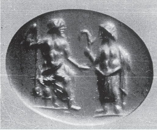
Abbildung 4: Kronos (r.) mit erhobener Sichel, vor seinem Vater Uranos. 40

genend (ebenso in altorientalischen) wurde/war eindrückliches ‚Attribut‘ des Kronos (und bei den Römern das des Saat- und Fruchtbarkeitsgottes Saturn). Als furchterregendes Dingsymbol des Kronos trifft man es in der griechischen und dann der römischen Bildenden Kunst vielfältig an (ebenso auf Münzen), auch sich verselbständigend als mythisches Symbol: Hesiods herausragend plzierter Kronos-Mythos von der Kastration des eigenen Vaters wurde zu einer Schlüsselerzählung aus der „Entstehung“ der Götter und der Welt.