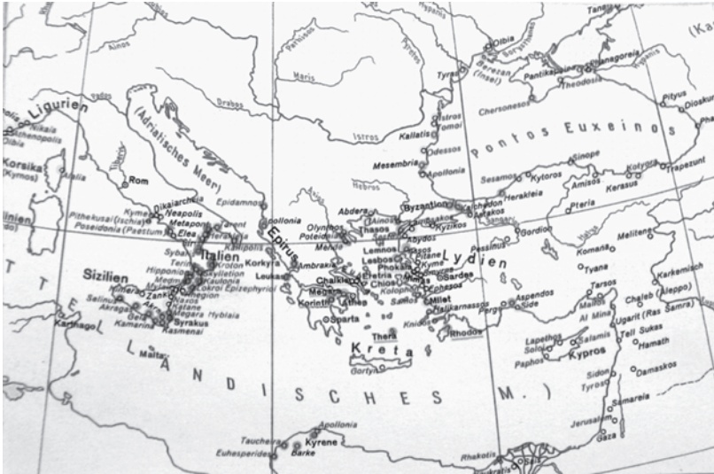
Abbildung 1: Die Mittelmeerwelt zur Zeit der Großen griechischen Kolonisation (um 750–um 550 v. Chr.) 21 .

Griechen, auch die Vorstellungswelt der Festlandsbewohner, erheblich erweiterten und differenzierten. Die Erkundungszüge erstreckten sich praktisch über das gesamte Mittelmeer (im Westen bis nach Gibraltar, den „Säulen des Herakles“) und darüber hinaus (von der Krim bis ins Niltal):