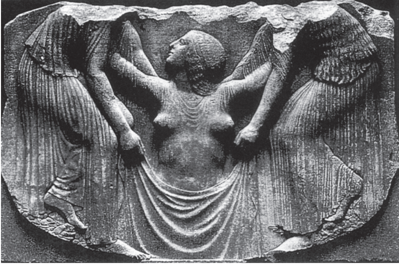
Abbildung 5: Die Geburt der Aphrodite 44 .

τῆ δ' Ἔρος ἀμάρτησε καὶ Ἴμερος ἔσπετο καλὸς γεινομένη τὰ πρῶτα θεῶν τ' ἐξ φύλον ἰούση.