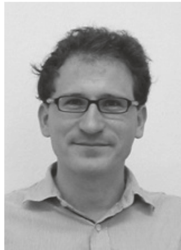
Marek Kowalski, Professor für Teilchenastrophysik an der Universität Bonn, Träger des Physik-Preises 2009

Mit IceCube entsteht im antarktischen Eis des Südpols der größte Neutrino-detektor der Welt, der, sobald er im Winter 2010/2011 fertiggestellt sein wird, über ein kubikkilometergroßes instrumentiertes Volumen verfügen wird. Das primäre Ziel des IceCube-Neutrinooteleskops ist der erstmalige Nachweis von hochenergetischen, astrophysikalischen Neutrinos. Deren Nachweis würde zum Beispiel einen Einblick in das Innere von Supernovasternexplosionen ermöglichen oder es erlauben, die Quellen der kosmischen Strahlung zu identifizieren. Im Folgenden wird das IceCube-Neutrinooteleskop vorgestellt und werden erste Resultate diskutiert. Weiter wird die Realisierung einer neuartigen Methode beschrieben, die auf der Vernetzung des IceCube-Detektors mit optischen Teleskopen beruht und die Nachweissensitivität von Neutrinos von Supernovae um ein Vielfaches erhöht.