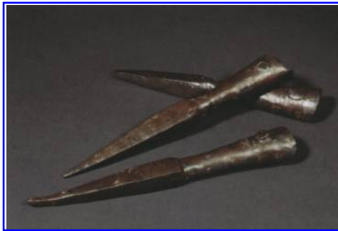
Abbildung 11: Römische Katapultbolzen-Spitzen vom Kampfplatz auf dem Harzhorn.