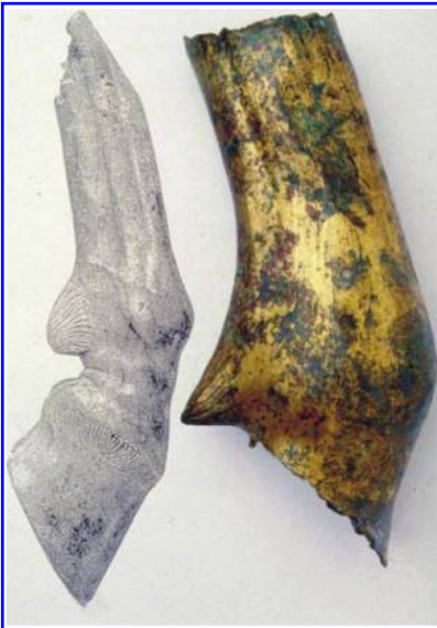
Abbildung 8: Waldgirmes: Überrest der zerstörten Reiterstatue.