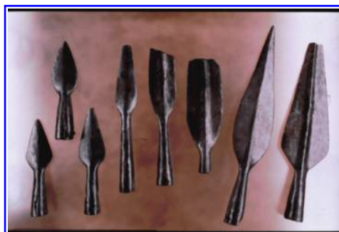
Abbildung 6: Römische Waffenfunde aus Hedemünden: Pfeilspitzen, Spitzen von Schleuderspeeren und Reiterlanzen (von links nach rechts)