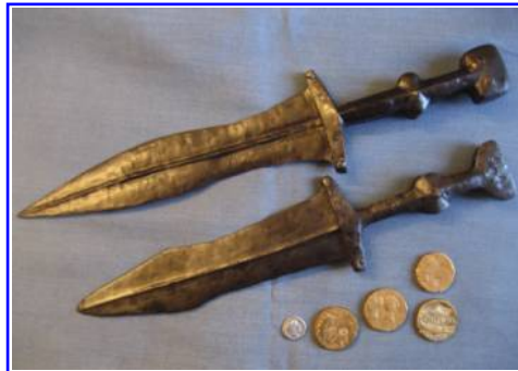
Abbildung 5: Legionärsdolche (Nahkampfwaffe) und datierende Fundmünzen (Drusus-Ära) aus Hedemünden.