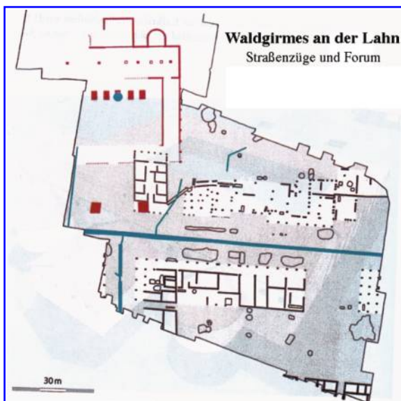
Abbildung 3: Waldgirmes: Straßenführung und Forumsanlage im Zentrum der Oppidum-Zivilsiedlung.

Als mutmaßliche „Insassen“ dieser weitestgehend nach mediterraner Urbanistik gestalteten Siedlung – mit Atriumhäusern (allerdings in Fachwerktechnik) und mit regelmäßigen, von Portiken umsäumten Straßenzügen (mit Tabernen und Werkstätten) – kommen führende Adelsfamilien des Tenkterer- oder auch des Chattenstammes in Betracht. Für die germanischen Einwohner, die bislang nur dörfliche Behausungen in Wohnstallhäusern kannten, muss all dies jedenfalls mit tiefen Veränderungen im Lebensstil und in ihrem Selbstgefühl verbunden gewesen sein. Im Mittelpunkt der voranschreitenden städtischen Bebauung aber befand sich eine monumentale Forumsanlage (mit 2200 qm Grundfläche für die Zivilsiedlung deutlich überdimensioniert), in deren Hof sich fünf steinerne Podeste (aus importiertem Kalkstein) befanden, auf denen sich mindestens eine sehr qualitätvolle, in vergoldeter Bronze ausgeführte Reiterstatue (vermutlich des Princeps) in voller Lebensgröße erhoben hat; ähnliche Bildnisse weiterer Angehöriger des Kaiserhauses waren möglicherweise noch in Vorbereitung. Im Zusammenhang mit einer in der gesamten Stadtanlage spürbaren Erhebung sind jedoch die kostbaren Sockelsteine und vor allem die „Kaiserstatue“ mit roher Gewalt in Teile zerhackt und zerrissen worden, so dass zahlreiche Bronzebruchstücke u.a. in die Straßengraben gerieten