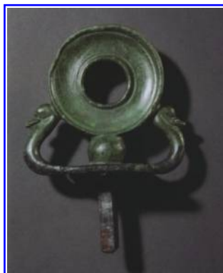
Abbildung 12: Reste eines römischen Wagenaufsatzes vom Kampfplatz auf dem Harzhorn.