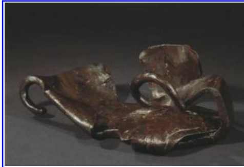
Abbildung 10: „Hippo-Sandale“ für Maultiere vom Kampfplatz auf dem Harzhorn.