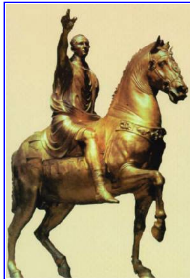
Abbildung 9: Waldgirmes: Rekonstruktion der Reiterstatue (vermutlich des Augustus).