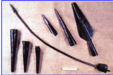
Abbildung 4: Römische Waffenfunde aus Hedemünden: Pilum, Lanzenspitze und -füße, Katapultbolzen-Spitzen.