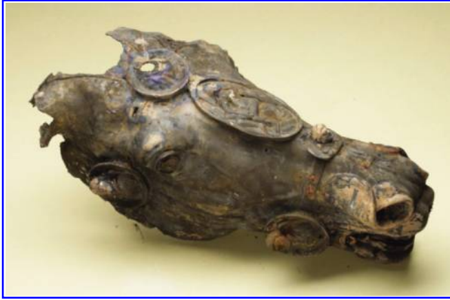
Abbildung 7: Überreste einer (wahrscheinlich 9 n. Chr. zerstörten) lebensgroßen Reiterstatue aus vergoldeter Bronze vom Zentralhof des Forums (der Pferdekopf wurde 2009 auf der Sohle eines 11m tiefen Brunnens gefunden).