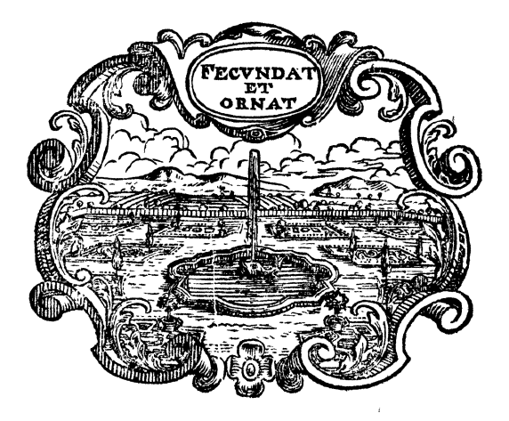
Gottingen, gedruckt bey Heinrich Dieterich.